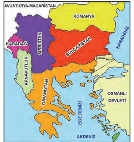
II. Balkan Savaşı sonrasında Balkanlar

Yalnızca yukarıda verilen bilgi ve haritalara bakarak,