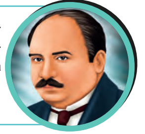
Mehmet Emin Yurdakul

Özellikle Türkçe ile ilgili şiirleriyle Mustafa Kemal üzerinde etkili olmuş ve ona ileride yapacağı dil inkılabı konusunda ilham vermiştir.