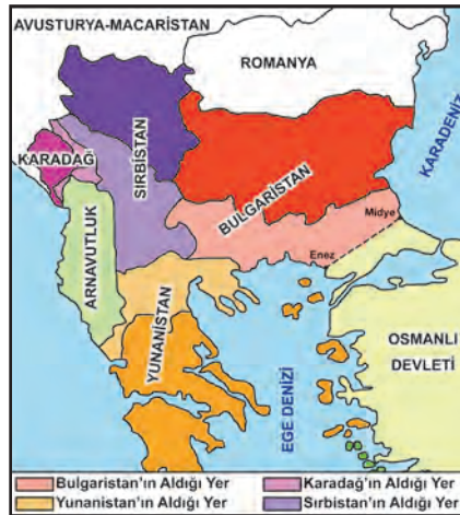
I. Balkan Savaşı sonrasında Balkanlar