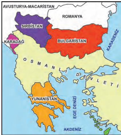
I. Balkan Savaşı öncesinde Balkanlar

10. Aşağıdaki haritalarda Osmanlı Devleti'nin Balkan Savaşları öncesi ve sonrası durumu gösterilmiştir.